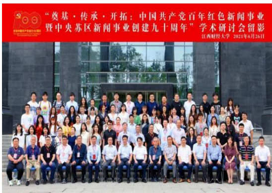
▲我院召开的中国共产党百年红色新闻事业研讨会