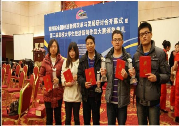
▲多名新闻学子在第二届大学生经济新闻作品大赛获奖